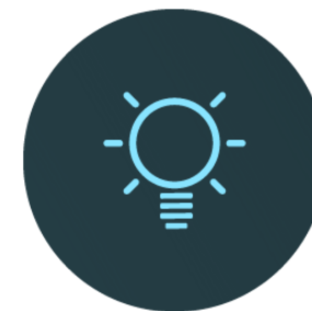
Illustration schématique de l'objet de l'innovation